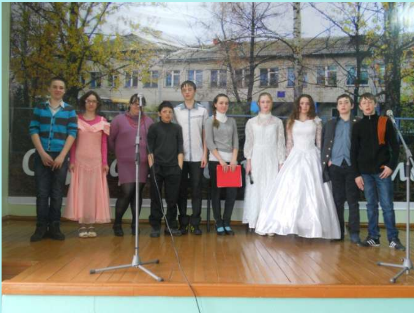
Внеклассное мероприятие «Вечер памяти декабристов», 8 класс.